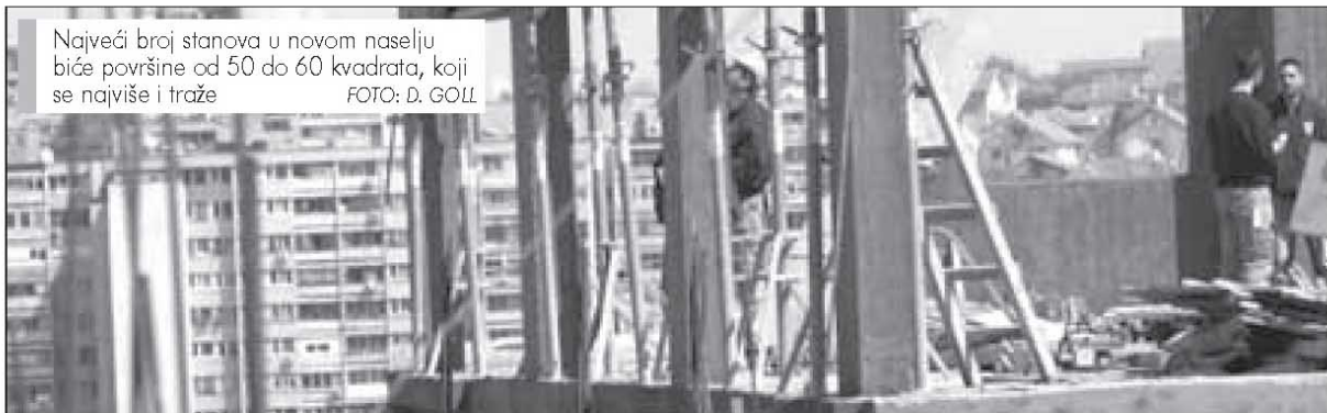
Najveći broj stanova u novom naselju biće površine od 50 do 60 kvadrata, koji se najviše i traže

Zgrade u „Stepi Stepanoviću“ do jeseni pod krovom