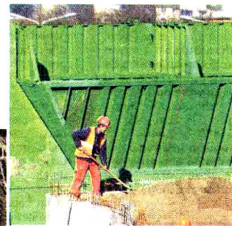
Angažovani radnici tri preduzeća