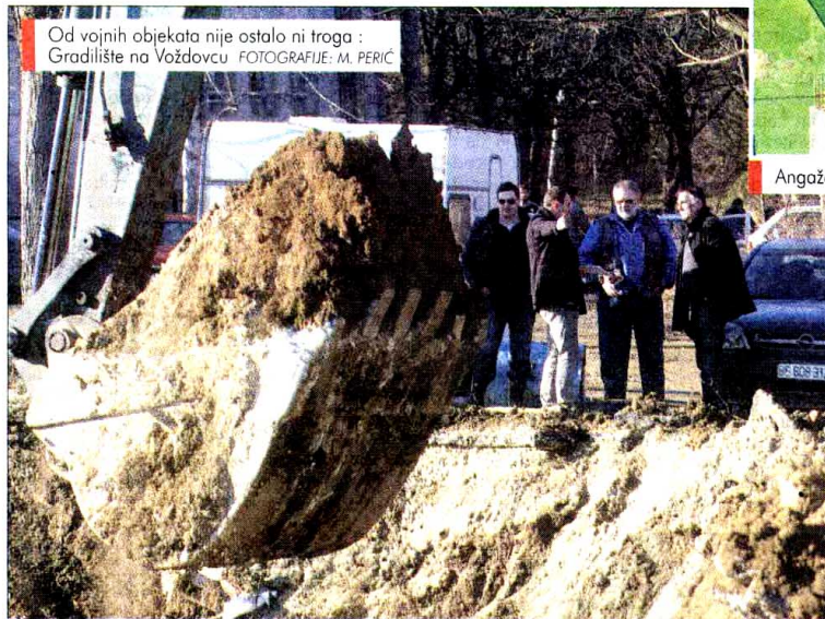
Od vojnih objekata nije ostalo ni traga : Gradilište na Voždovcu.

Gradevince poslužilo vreme, pa se očekuje da se obrisi budućih zgrada vide već u februaru, a 1.450 stanova bude završeno do marta 2012. godine